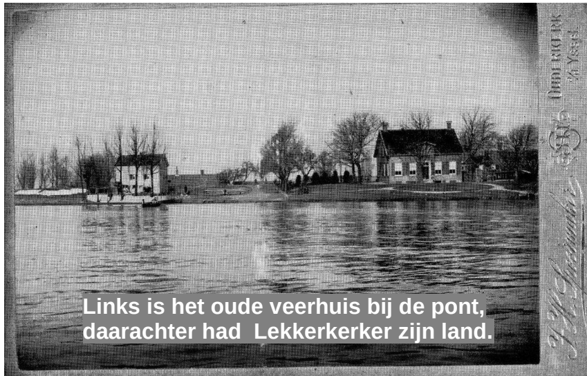
Links is het oude veerhuis bij de pont, daarachter had Lekkerkerker zijn land.