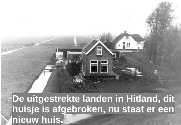
De uitgestrekte landen in Hitland, dit huisje is afgebroken, nu staat er een nieuw huis.